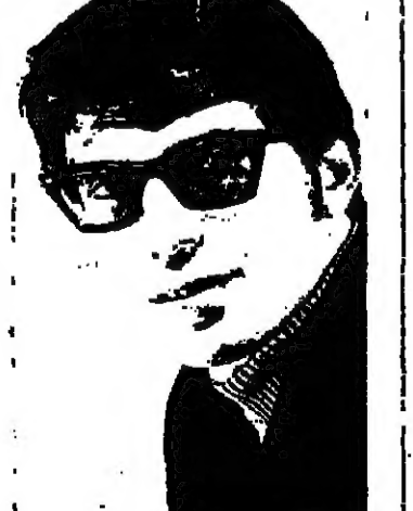
وقد ادلى السيد ابو حنيفة بهذه الاقوال مساء أمس بعد ان حضر جلسة لجنة

سائلين المولى تعالى ان يتفهمه بوفاته ويسكنه فسيح جناته، ويطلع آله وذويه الصبر والسلوان.